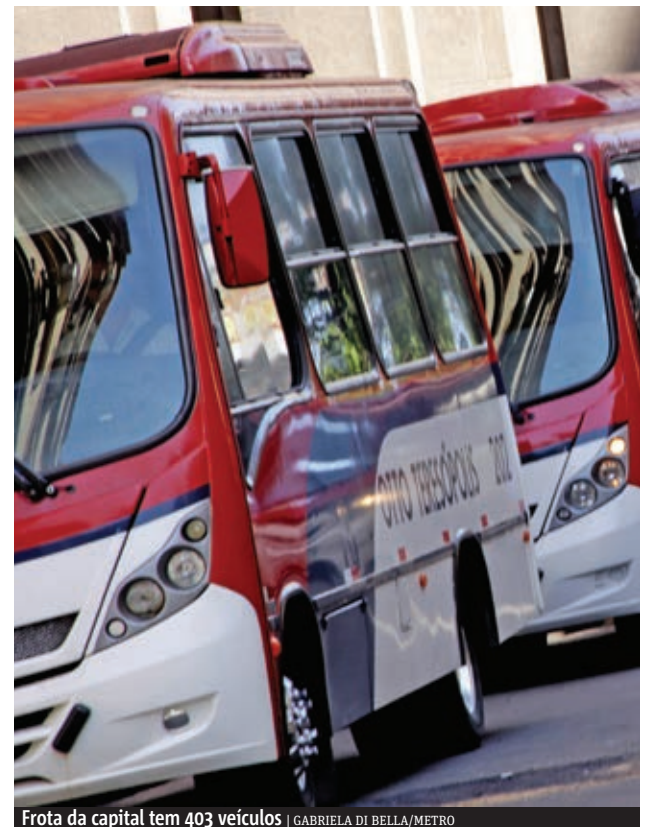
Frota da capital tem 403 veículos